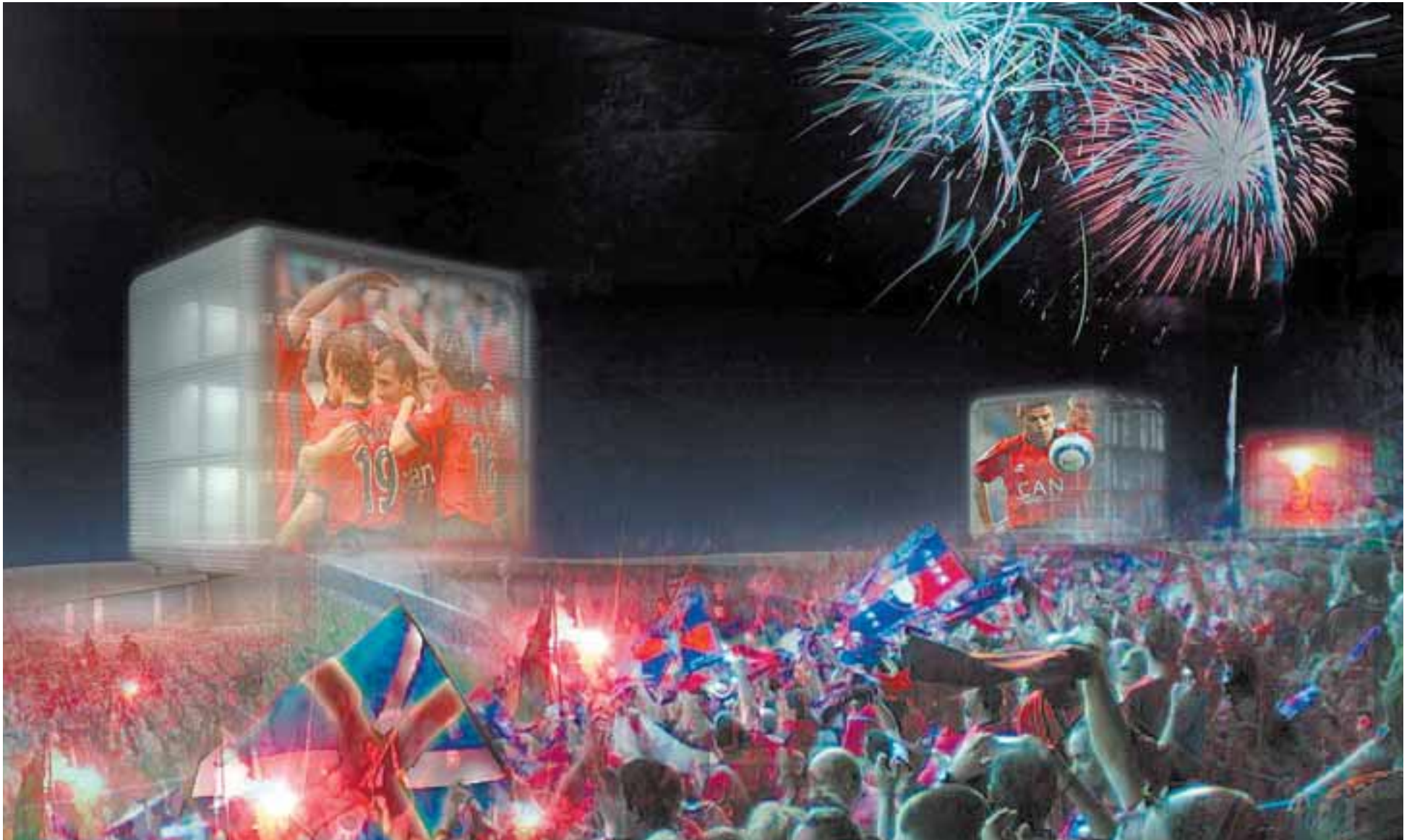
Recreación de un partido de Osasuna proyectado en las fachadas de los Cubos de Sarriguren elaborada por los autores del proyecto.

La empresa pública Miyabi, participada por Sodena y Vinsa, prevé convertir los 15 edificios-cubo que ubicará en el parque de Sarriguren en el "mayor museo electrónico al aire libre de Europa"